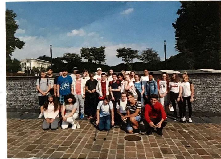
Ausflug nach Metz